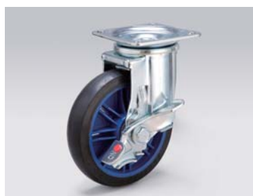
ペダルブレーキ 自在キャスター Swivel caster/Pedal brake 品番: WSG-150RB-PS 1.70kg