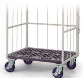
床板プラスチックタイプ Plastic base plate type

ベージュ Blue グリーン グレー オレンジ Beige Blue Green Gray Orange