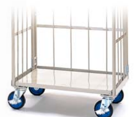
床板スチールタイプ Steel base plate type