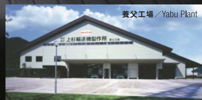
養父工場 / Yabu Plant

私たちUESUGIが何よりも大切にしているのは「モノづくり」へのこだわりです。多くの企業が生産拠点を次々と海外へ移すなか、国内自社工場で一貫生産をおこなっているのも、製品に対して一切の妥協を許さない姿勢のあらわれ。これにより、高品質な製品を国内はもちろん、世界各国へ短納期で安定供給しています。また、最新鋭設備による自動化・省力化を積極的に進め、生産工程のムダを徹底的に省くカンバン方式も導入。確かなクオリティとすぐれたコストパフォーマンスで、多くの皆さまから確かな信頼を得ています。