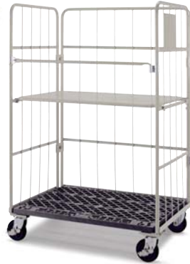
スチール中間棚付き/ The steel middle is with a shelf