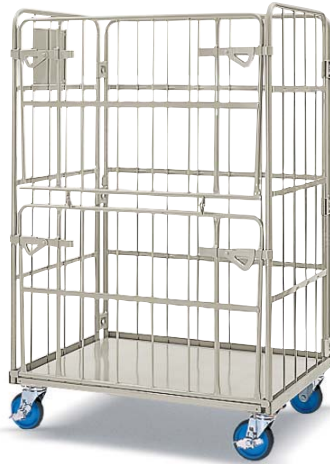
ダブルゲート付き / Double gates