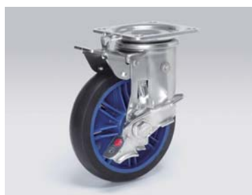
ペダルブレーキ ターンロックキャスター 自在・固定切り替え、押すタイプ Turn lock caster push type/Pedal brake 品番: WSTLP-150RB-PS 1.89kg