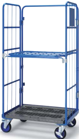
カテゴリーカート / Category cart