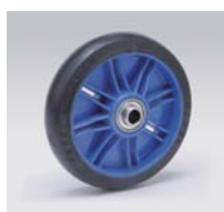
黒ゴム Black Rubber 品番: 150RB 34mm