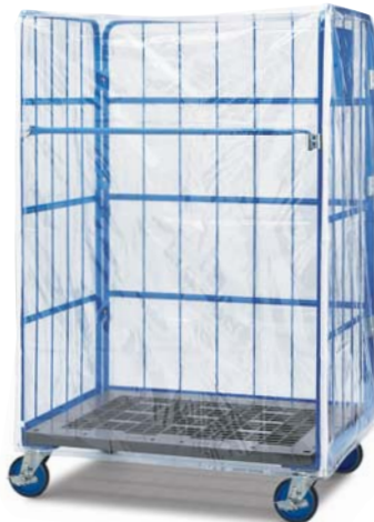
防塵カバー / Dust-proof cover