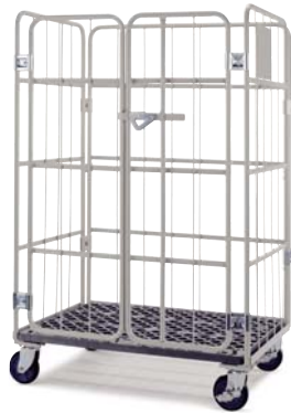
観音扉 / Double doors