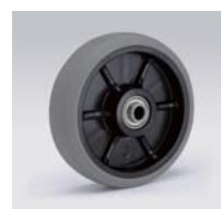
ウレタン Urethane 品番: 150UG 40mm