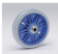
グレーゴム Gray Rubber 品番: 150RG 34mm