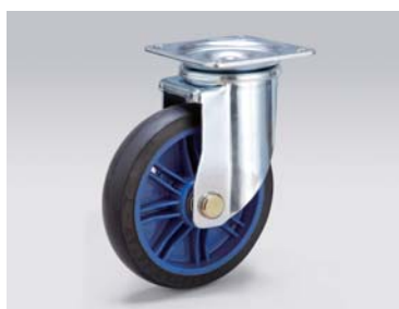
自在キャスター Swivel caster 品番: WSG-150RB 148kg