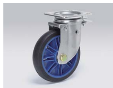
ターンロックキャスター 自在・固定切り替え、引くタイプ Turn lock caster draw type 品番: WSTLD-150RB 1.75kg