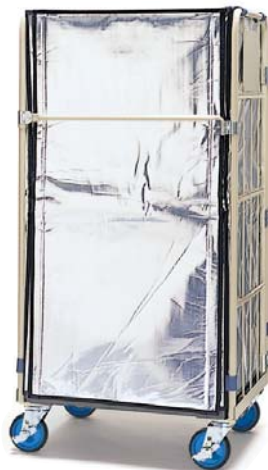
保冷カバー / Cool-insulation cover