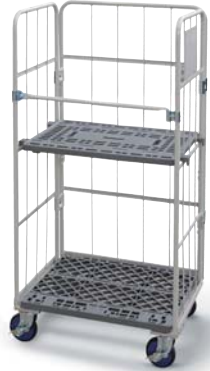
プラスチック中間棚付き/ The middle of plastic is with a shelf