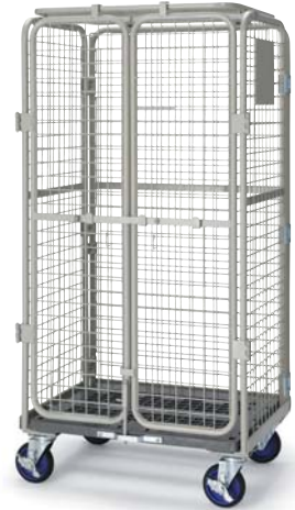
セキュリティーカーゴ / Security cargo