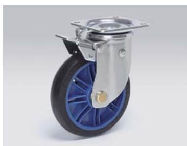
ターンロックキャスター 自在・固定切り替え、押すタイプ Turn lock caster push type 品番: WSTLP-150RB 1.70kg